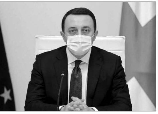
(Շարունակությունը՝ 2-րդ էջում)

- Ես ուզում եմ այսօր կառավարության միստին նոր նախաձեռնություն ներկայացնել: Մենք սկսում ենք ողջ երկրի տարածքով նորացում: Այս ծրագիրը ներառում է 63 քաղաքապետարանում քաղաքաշինության վերականգնում, կարելու է մշակութային եւ պատմական ժառանգության օբյեկտների վերականգնում, քաղաքապետարաններում վարչական կենտրոնների վերականգնում, ինչպես նաեւ հանգստի տարածքների ստեղծում, զբոսաշրջային ենթակառուցվածքների զարգացում