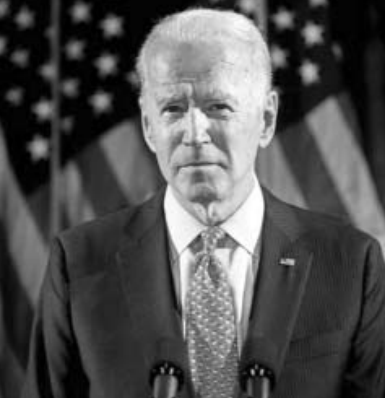
(Շարունակությունը՝ 7-րդ էջում)

- Ամեն տարի այս օրը մենք հիշում ենք նրանց, ովքեր զոհվեցին Օսմանյան ժամանակաշրջանի Հայոց ցեղասպանության ժամանակ, եւ պարտավորվում ենք կանխել նման չարագործությունների կրկնությունը: Սկսած 1915 թվականի ապրիլի 24-ից՝ օսմանյան իշխանությունների կողմից Կոստանդնուպոլսի հայ մտավորականության եւ համայնքի առաջնորդների ձերբակալություններից հետո, մեկուկես միլիոն հայեր տեղահանվեցին, կոտորվեցին կամ մահվան ուղարկվեցին՝ բնաջնջման նպատակով: (Շարունակությունը՝ 7-րդ էջում)