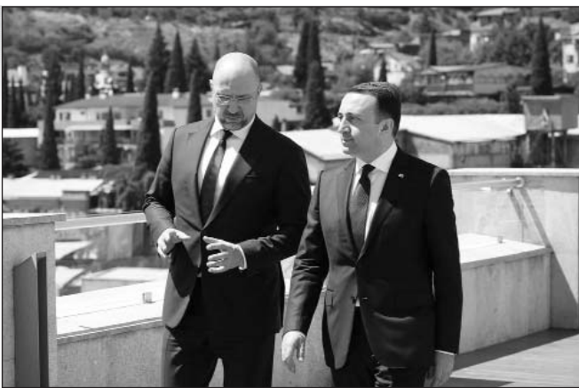
(Շարունակությունը՝ 2-րդ էջում)

Այցի շրջանակներում, ուկրաինացի հյուրը հանդիպումներ ունեցավ Վրաստանի վարչապետ Իրակլի Դարիբաշվիլու, Վրաստանի խորհրդարանի նախագահ Կախա Կուճավայի, ինչպես նաև Համայն Վրաստանի Կաթողիկոս-Պատրիարք Իլիա Երկրորդի հետ: Դենիս Շմիգալը, պատվիրակության անդամների հետ միասին, հարգանքի տուրք մատուցեց Վրաստանի միասնության համար զոհված հերոսների հիշատակին եւ ծաղկեպսակով զարդարեց Հերոսների հրապարակում գտնվող հուշահամալիրը: