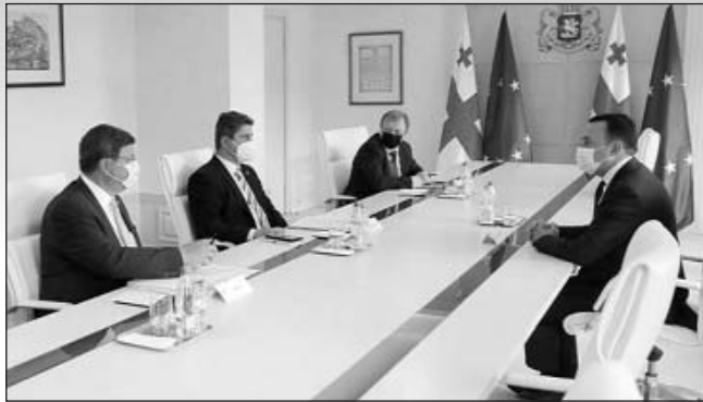
ԻՏՐԱՅԵԼ ԻՑՅԱԿ ՅԵՐՑՈՂԸ՝ ԵՎՐՈՒ ՆԱԽԱԿԱՐ

Հունիսի 1-3-ին Վրաստանում էին Եվրոպայի խորհրդի խորհրդարանական վեհաժողովի մոնիտորինգի կոմիտեի անդամները: Պատվիրակության կազմում էին Տիտուս Քորլաթեանը՝ համագեկուցող, Ռումինիայի «Առցիալիստների խումբը», Կլոդ Քեռնը՝ համագեկուցող, Ֆրանսիայի «Լիբերալների և դեմոկրատների դաշինք» Եվրոպայի համար» և Բաս Քլեյնը՝ Եվրոպայի խորհրդարանի մոնիտորինգի կոմիտեի քարտուղարության ղեկավարի տեղակալ: