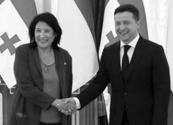
(Շարունակությունը՝ 3-րդ էջում)

Ինչպես նշվեց համատեղ հայտարարության մեջ, կողմերը քննարկել են Վրաստանի եւ Ուկրաինայի