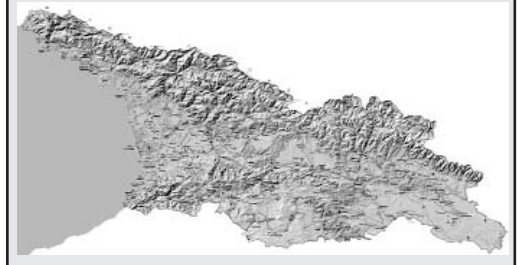
ՄԵԿՆԱՐԿԵՑ ՊԱՐՏԱԴԻՐ ԶԻՆՎՈՐԱԿԱՆ ԱՇՆԱՆԱՅԻՆ ԶՈՐԱԿՈՉԸ

րաժեշտ է, քանի որ պետական ծառայությունում աշխատող մարդիկ այլևս չեն տեսնում մոտիվացիա, մենք չենք կարող մրցակցել մասնավոր հատվածի հետ, ուստի, անհրաժեշտ է անդրադառնալ այս խնդրին, ինչը մենք անպայման կանենք 2022 թվականի հունվարից, ինչպես նաև կբարձրացնենք քաղաքապետերի աշխատավարձը: Մենք որոշել ենք այն գործնականում կրկնապատկել: Քաղաքապետի համար աներեւակայելի է աշխատել 2000 լարիով եւ ծառայել Քուբայիսիին ու Բաթումիին, դա աներեւակայելի է, եւ այս հարցը ժամանակին լուծման կարիք ունի,- նշեց Իրակլի Ղարիբաշվիլին: