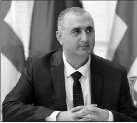
Վրաստանի վարչապետ Իրակլի Դարիբաշվիլու նախածեռնությանը մշակվում է երկրի զարգացման 10-ամյա ծրագիրը: Այդ ծրագրի շրջանակներում բոլոր գերատեսչությունները ներկայացնում են առաջիկա 10 տարիների իրենց գործունեության տեսլականը: Առաջիկա 10 տարիների գործունեության ծրագիրը ներկայացրեց նաև Վրաստանի ֆինանսների նախարարությունը:

տարիների գործունեության ծրագիրը ներկայացրեց նաև Վրաստանի ֆինանսների նախարարությունը: