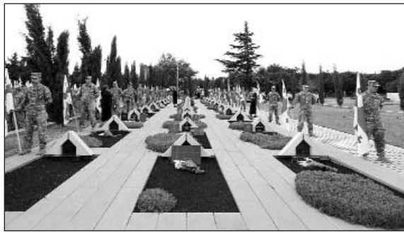
համալրել փախստականների եւ բռնի տեղահանվածների շարքերը:

Ըստ պաշտոնական տվյալների՝ այս իրազ օրերին օսական կողմն ունեցել է 365 կորուստ, վրացական կողմը՝ 412: Ձեռք էին նաեւ 67 ռուս խաղաղապահներ: Հարավային Օսեթիայի տարածքում գտնվող վրացական զյուղերի մոտ 80 հազար բնակիչ լքել են բնակավայրերն ու