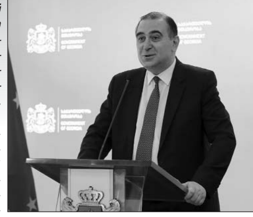
(Շարունակությունը՝ 3-րդ էջում)

Վրաստանի կրթության նախարար Միխեիլ Չխենկելու խոսքով՝ հոկտեմբերի 4-ին ուսումնական գործընթացը կշարունակվի ինչպես պետական, այնպես էլ՝ մասնավոր