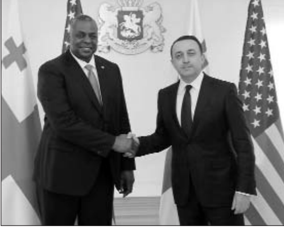
(Շարունակությունը՝ 2-րդ էջում)

Հանդիպումներին քննարկվեցին Վրաստանի եւ ԱՄՆ-ի համագործակցության հարցերը, գլոբալ անվ-