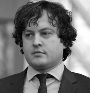
էջը պատրաստեց ՅՈՒՐԻ ՊՐՈՄՅԱԼԸ

Նշենք, որ Ծալենջիխայի մունիցիպալիտետի սակրեբուլյոյում Կոռնելի Սալիխյան կողմ է քվեարկել 14 պատգամավոր: «Վրացական երազանք» խմբակցության անդամները չեն մասնակցել ընտրություններին: Ընտրություններից հետո նրանք ի նշան բողոքի լքել են միստը: