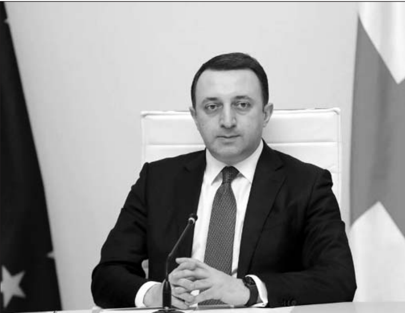
Ինչպես նշեց Իրակլի Դարիբաշվիլին, 2020 թվականի դեկտեմբերին ծրագրված 2021 թվականի բյուջեն ձեռնարկվեց համավարակային և տնտես-

Վրաստանի կառավարության հերթական նիստում, Վրաստանի վարչապետ Իրակլի Դարիբաշվիլին հանրագումարեց 2021 թվականի բյուջետային տարվա արդյունքները, ներկայացրեց մակրոտնտեսական և ֆինանսական պարամետրերը, որոնք վավերացվել են անցյալ տարի, չնայած կորոնավիրուսի համավարակով պայմանավորված մարտահրավերների: