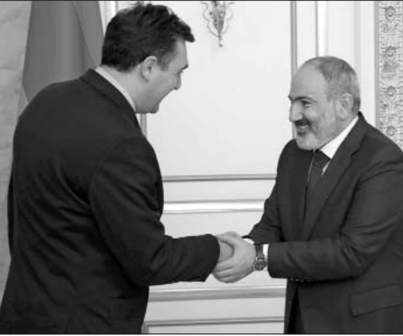
Փաշինյանը նշեց. (Շարունակությունը՝ 4-րդ էջում)

Վրաստանի արտաքին գործերի նախարար Իլիա Դարչիաշվիլու եւ Հայաստանի վարչապետ Նիկոլ Փաշինյանի հանդիպմանը Հայաստանի կառավարության ղեկավարը հյուրին շնորհավորեց Վրաստանի ԱԳ նախարարի պատասխանատու պաշտոնում նշանակվելու կապակցությամբ եւ մաղթեց արդյունավետ աշխատանք: Բարձր գնահատելով հայ-վրացական բարեկամությունը՝ Նիկոլ