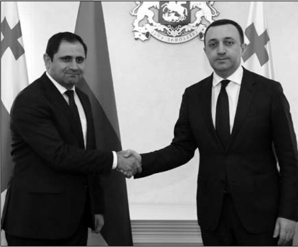
(Շարունակությունը՝ 4-րդ էջում)

Այցի մեկնարկի, կայացավ Վրաստանի եւ Հայաստանի պաշտպանության նախարարների հանդիպումը, որտեղ քննարկվեցին պաշտպանական ոլորտում երկկողմ համագործակցության զարգացման հեռանկարները ռազմակրթության, փորձի փոխանակման, բարեվարքության եւ մարդու իրա-