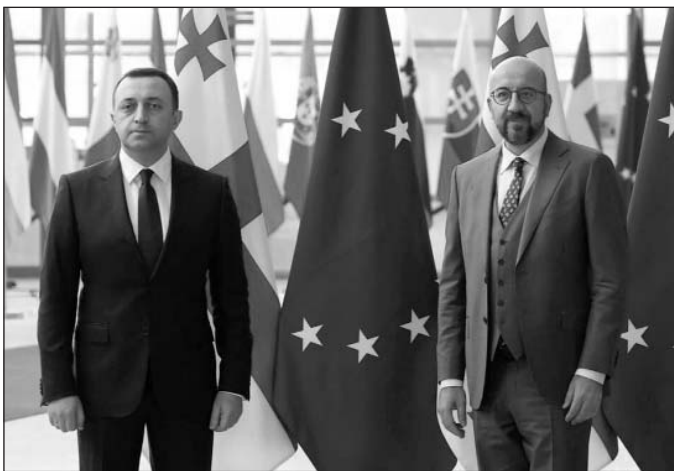
(Շարունակությունը՝ 2-րդ էջում)

Աշխատանքային այցի շրջանակներում, Վրաստանի վարչապետը Բրյուսելում հանդիպումներ ունեցավ Եվրոպական խորհրդի նախագահ Շառլ Միշելի, Եվրախորհրդարանի նախագահ Ռոբերտա Մեցոլայի, Եվրամիության արտաքին գործերի եւ անվտանգության քաղաքականության գերագույն ներկայացուցիչ, Եվրահանձնաժողովի փոխնախագահ Ջոզեֆ Բորելի, Եվրոպական հարեւանության քաղաքականության եւ ընդլայնման հարցերով եվրահանձնակատար Օլիվեր Կարինի հետ: