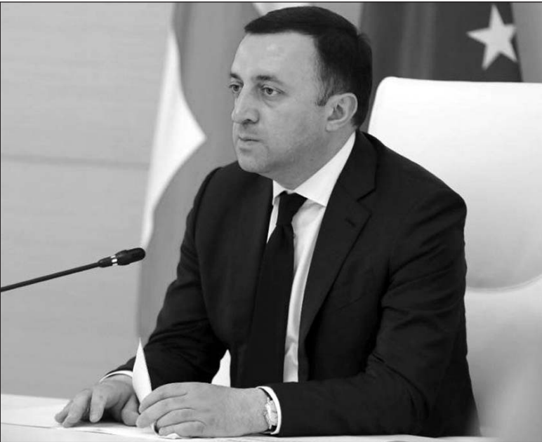
(Շարունակությունը՝ 4-րդ էջում)

Հունիսի 6-ին, Վրաստանի վարչապետ Իրակլի Գրիբաշվիլու գլխավորությամբ, անցկացվեց երկրի կառավարության հերթական նիստը, որի մեկնարկում վարչապետը հակիրճ ամփոփեց Բրյուսել կատարած այցի արդյունքները, ինչպես նաև՝ Եվրամիության անդամության թեկնածուի կարգավիճակի հետ կապված հարցեր: