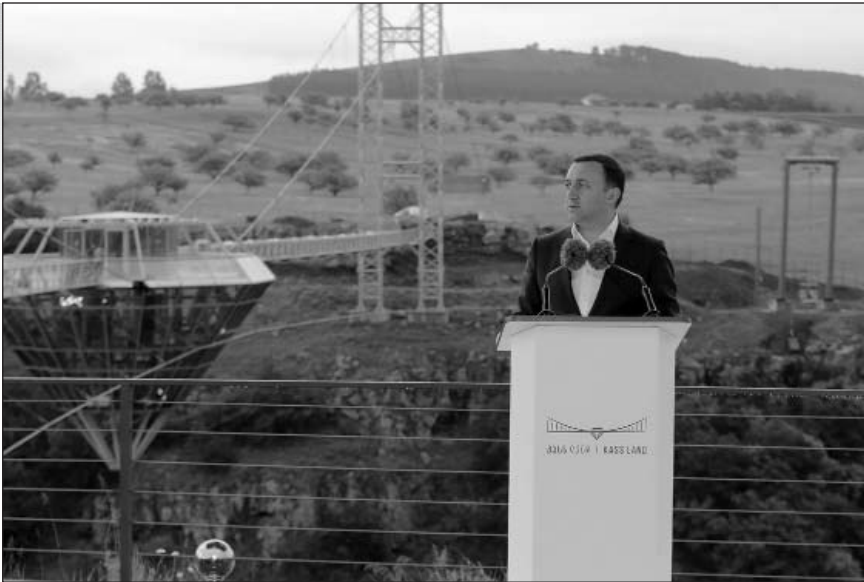
(Շարունակությունը՝ 4-րդ էջում)

Երկրամասում զբոսաշրջության զարգացմանը նպաստող ենթակառուցյի բացմանը ներկա էին Վրաստանի վարչապետ Իրակլի Դարիբաշվիլին, երկրի կառավարության անդամներ, խորհրդարանի պատգամավորներ, Վրաստանում հավատարմագրված դիվանագիտական կորպուսի եւ հասարակական կազմակերպությունների, լրատվամիջոցների ներկա-