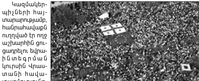
Գերլու Վրաստանի ցանկությունը՝ Եվրամիության անդամակցելու համար (Շարունակությունը՝ 4-րդ էջում)

Հունիսի 20-ին Թբիլիսիում, Ռուսթավելու պողոտայում, խորհրդարանի շենքի դիմաց, «Սիրցխվիլիա» («Ամոթ է») քաղաքացիական շարժման նախաձեռնությամբ, անցկացվեց բազմամարդ հանրահավաք: