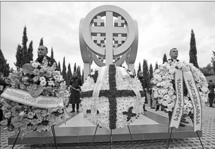
(Շարունակությունը՝ 2-րդ էջում)

Հաջորդ օրերին ռուսական ավիացիան ռմբակոծեց Վազիսի եւ Սենակիի ռազմաբազաները, Մառնեուլիի ռազմական օդանավակայանը, Գորի քաղաքը, Փոթիի նավահանգիստը եւ Կոդորիի կիրճը: