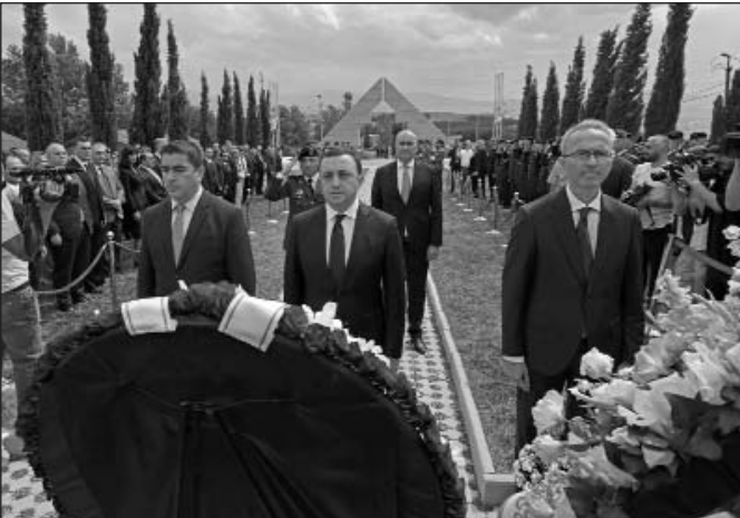
(Շարունակությունը՝ 2-րդ էջում)

Իմ եւ կառավարության անունից ցանկանում եմ վշտակցություն հայտնել մեր զոհված հերոսների ընտանիքներին, մեր զին-