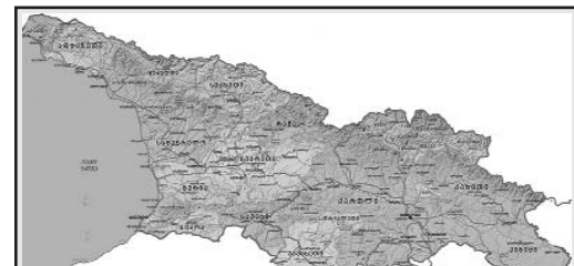
ՍԿԱՎԵՑ ԽՈՐՀՐԴԱՐԱՆԻ ԱՇՆԱՆԱՅԻՆ ՆԱՏԱՇՐՋԱՆԸ