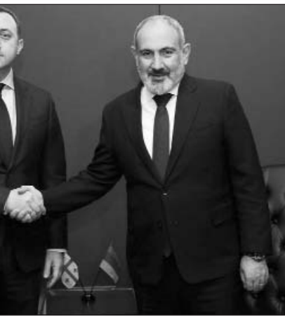
Սեպտեմբերի 24-ին, Նյու Յորքում ՄԱԿ-ի գլխավոր ասամբլեայի 77-րդ նստաշրջանի շրջանակներում, Վրաստանի վարչապետ Իրակլի Դարիբաշվիլին հանդիպում ունեցավ Հայաստանի վարչապետ Նիկոլ Փաշինյանի հետ:

Սեպտեմբերի 24-ին, Նյու Յորքում ՄԱԿ-ի գլխավոր ասամբլեայի 77-րդ նստաշրջանի շրջանակներում, Վրաստանի վարչապետ Իրակլի Դարիբաշվիլին հանդիպում ունեցավ Հայաստանի վարչապետ Նիկոլ Փաշինյանի հետ: Վրաստանի կառավարության հաղորդագրությամբ, Վրաստանի եւ Հայաստանի վարչապետները քննարկել են երկու երկրների միջեւ համագործակցության օրակարգի հիմնական հարցերը: Նշվել է, որ երկու երկրների միջեւ հարաբերությունները դինամիկ են զարգանում, ինչը