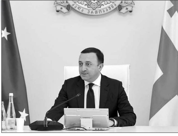
Սեպտեմբերի 30-ին Վրաստանի վարչապետ Իրակլի Դարիբաշվիլու նախագահությամբ անցկացվեց երկրի կառավարության հերթական նիստը:

Սեպտեմբերի 30-ին Վրաստանի վարչապետ Իրակլի Դարիբաշվիլու նախագահությամբ անցկացվեց երկրի կառավարության հերթական նիստը: Վարչապետը ներկայացրեց հաջորդ տարվա պետական բյուջեի ծրագրման մանրամասները: - Կուզեի իրագրել մեր բնակչությանը հաջորդ տարվա բյուջեի վերաբերյալ: Եվ սակայն, մինչ այդ հակիրճ գնահատական տամ եւ հիշեցնեմ հանրությանն ու կառավարության անդամներին, թե ինչպիսին էր մեկնակետը երկու տարի առաջ: Ինչպես գիտեք, Վրաստանի տնտեսության վրա մեծ ազդեցություն գործեց համաճարակը, տնտեսությունը կրճատվեց 6,8 տոկոսով, ինչը հանգեցրեց տնտեսական անկման, մեր եկամուտների նվազման, աղքատացման, գործազրկության աճի եւ այլն: Միաժամանակ (Շարունակությունը՝ 2-րդ էջում)