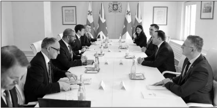
տակով, Մեծ Բրիտանիան տրամադրում է նաեւ 500,000 ֆունտ ստեռլինգ, որի նպատակն է ստեղծել միջավայր 2024 թվականին ազատ ու արդար ընտրությունների համար եւ պաշտպանել դրանք արտաքին միջամտություններից:

Վրաստանում ժողովրդավարության ամրապնդման նպատակով, Մեծ Բրիտանիան տրամադրում է նաեւ 500,000 ֆունտ ստեռլինգ, որի նպատակն է ստեղծել միջավայր 2024 թվականին ազատ ու արդար ընտրությունների համար եւ պաշտպանել դրանք արտաքին միջամտություններից: