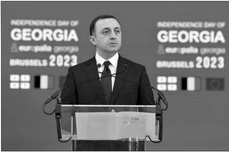
Հանդիսավոր միջոցառմանը իր խոսքում Վրաստանի վարչապետն անդրադարձավ Եվրամիության (Շարունակությունը՝ 2-րդ էջում)

Այցի շրջանակներում՝ Վրաստանի վարչապետը հանդիպումներ ունեցավ ինչպես Բելգիայի, այնպես էլ՝ Եվրամիության ղեկավարների հետ: Մասնավորապես, Իրակլի Դարիբաշվիլին հանդիպումներ ունեցավ Բելգիայի Թագավորության վարչապետ Ալեքսանդր Դե Կրոյին, Ներկայացուցիչների պալատի նախագահ Էլիան Թիլբրի, Եվրամիության խորհրդի նախագահ Շառլ Միշելի, Եվրահանձնակատար Օլիվեր Վարդեի հետ, Բրյուսելում մասնակցեց «Europalia» միջազգային փառատոնին եւ Վրաստանի Անկախության տոնի հանդիսավոր միջոցառմանը: