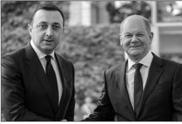
Վրաստանի վարչապետ Իրակլի Դարիբաշվիլին և Գերմանիայի կանցլեր Օլաֆ Շոլցը խոսեցին նաեւ երկու երկրների միջեւ սերտ գործընկերության ու բարեկամական հարաբերությունների, տարածաշրջանում եւ աշխարհում անվտանգության միջավայրի մասին, անդրադարձան Վրաստանի Եվրատվանային ինտեգրմանը եւ վերջին տարիներին ձեռք բերված առաջընթացին:

Իրակլի Դարիբաշվիլին եւ Օլաֆ Շոլցը խոսեցին նաեւ երկու երկրների միջեւ սերտ գործընկերության ու բարեկամական հարաբերությունների, տարածաշրջանում եւ աշխարհում անվտանգության միջավայրի մասին, անդրադարձան Վրաստանի Եվրատվանային ինտեգրմանը եւ վերջին տարիներին ձեռք բերված առաջընթացին: