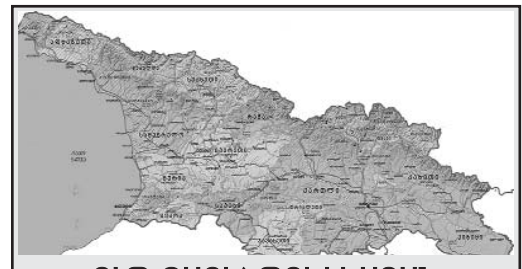
ՈՒԹ ՏԱՐԻ ԹԲԻԼԻՍՅԱՆ ՈՂԲԵՐԳՈՒԹՅՈՒՆԻՑ ՀԵՏՈ

- Ուզում էի եւս մեկ անգամ նշել, որ մենք ունենք շատ դրական միտումներ տնտեսության ուղղությամբ: Այս մասին տեղեկություն ունի բնակչությունը, մեր հասարակությունը: Հատկապես բարձր ցուցանիշ են պահպանում ուղղակի օտարերկրյա ներդրումները: Առաջին եռամսյակում Վրաստանում գրանցվել է գրեթե կես միլիարդ դոլարի օտարերկրյա ուղղակի ներդրումներ, ինչը, իհարկե, շատ դրական է, սաաց վարչապետը: