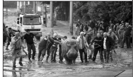
21 զոհ, երկու անհետ կորած եւ հազարավոր տուժած քաղաքացիներ... հունիսի 13-ի աղետից ութ տարի է անցել:

2015 թվականի ջրհեղեղը ավերեց բնակելի տներ, ճանապարհներ, կամուրջներ, թունելներ, հենապատեր, կապի համակարգեր: Ամբողջությամբ հեղեղվեցին «Սզիուրի» եւ կենդանաբանական այգու տարածքները: Աղետի հետեւանքով զոհվեց կենդանաբանական այգու բնակիչների մի մասը: Տուժեցին քաղաքի ենթակառուցվածքները, այդ թվում՝ Վակե-Սաբուրթալո կապող վերգետնյա անցումը, Կոչորի-Սամաղո կապող ճանապարհը, Ախալաբա-Օղնեթի ճանապարհի հատվածը: