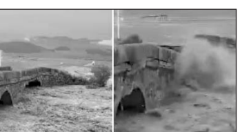
Էջը պատրաստեց ՅՈՒՐԻ ԽՈՐԵՆՅԱՆԸ

Ծալկայի մունիցիպալիտետի Դուշի գյուղի 19-րդ դարում կառուցված կամուրջը փլուզվել է: Հունիսի 13-ին, հորդառատ տեղումների պատճառով, վարարել է Խրամ գետը, եւ ջրի առատ հոսքը դարձել է կամարատիպ կամրջի փլուզման պատճառ: Նշենք, որ կամուրջը կառուցվել է երզրումից գաղթած հայերը՝ 1872 թվականին: Կամուրջը կառուցված էր ձվերով, մինչ օրս կանգուն էր եւ երթեւեկելի: Որոշ աղբյուրներում կամրջի կառուցող է հիշատակվում Հովակիմ Մեիրաբյանը: Քարե կամուրջը կապում էր Դուշի գյուղը հարեւան Արծիվան գյուղի հետ: