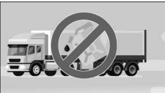
ՖԻՆԱՆՍՆԵՐԻ ՆԱԽԱՐԱՐՈՒԹՅԱՆ ԵԿԱՄՈՒՏՆԵՐԻ ԾԱՌԱՅՈՒԹՅՈՒՆ

հողվածի համաձայն՝ իրավախախտումն թույլ տված անձանց համար սահմանվեց վարչական պատժամիջոց, գործը քննության համար առաքվել է դատական մարմիններին: