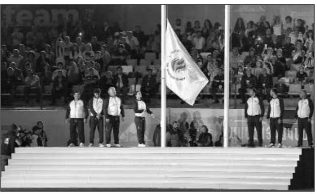
(Շարունակությունը՝ 7-րդ էջում)

մար Հայաստան է ժամանել 41 պետության 179 քաղաքի 7161 պատվիրակ: Ապա սկսվեց հանդիսավոր շքերթը, որի ընթացքում մարզադաշտ են մտնում Համահայկական 8-րդ ամառային խաղերի մասնակից քաղաքների պատվիրակությունները: