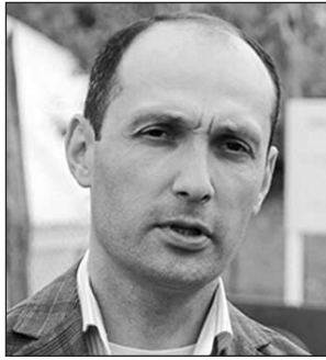
Վրաստանի վարչապետ Իրակլի Դարիբաշվիլի

Շովիում տեղի ունեցած տարերային աղետի կապակցությամբ՝ վրաց ժողովրդին իրենց ցավակցությունն ու օգնության պատրաստակամությունն են հայտնել բա-