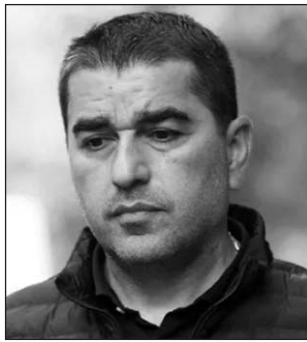
Վրաստանի խորհրդարանի նախագահ Շավլա Պապուաշվիլի

- Սոցցանցերում հրապարակվել են որոշ բանկային հաշիվներ, գումար հավաքելու կոչ կա, դրանց թվում երկու տարբեր էջերում տեսել եմ նույն բանկային հաշիվը, չեմ ուզում կասկածել որեւէ մեկի անկեղծությանը, բայց, իհարկե, խարդախության մեծ ռիսկ կա,- ասաց Շավլա Պապուաշվիլին: