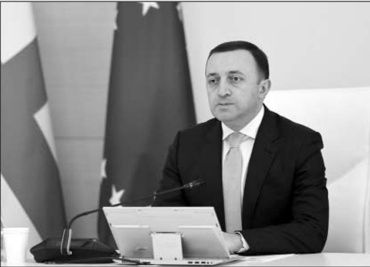
ԼԸ տրանսպորտի և լոգիստիկայի ոլորտում (Շարունակությունը՝ 2-րդ էջում)

Օրակարգում ընդգրկված 22 հարցերի թվում կառավարությունը հաստատեց 2023-2030 թվականների «Տրանսպորտի և լոգիստիկայի ազգային ռազմավարությունն ու դրա 2023-2024 թվականների գործողությունների ծրագիրը»: Ռազմավարությունը ներառում է երկարաժամկետ տեղական նպատակներ և խնդիրներ՝ նպաստելու Վրաստանի՝ որպես տարածաշրջանային տրանսպորտային և լոգիստիկ հանգույցի կայացմանը: Միևնույն ժամանակ, ռազմավարությունը նպատակ ունի զարգացնել մարդկային կապիտա-