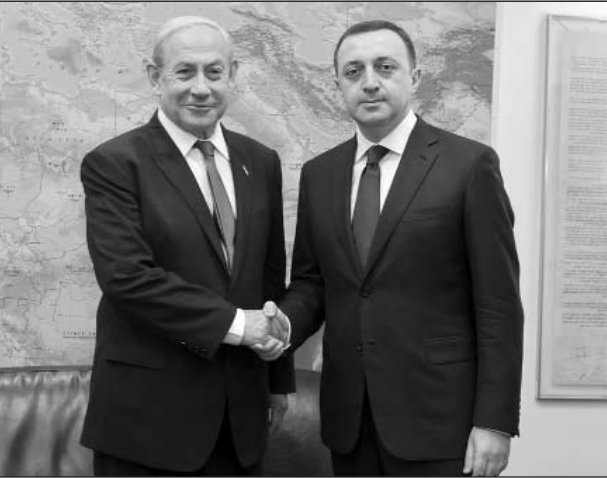
Հատ ջերմ հարաբերություններ ունեն: - Մեր ազգերի կապը 2500 տարիների պատմություն ունի կամ գուցե նույնիսկ 2600: Վրաստանում ապրում էին հրեական համայնքներ: Շատ հրեաներ (Շարունակությունը՝ 2-րդ էջում)

Օգոստոսի 16-17-ը Վրաստանի վարչապետ Իրակլի Դարիբաշվիլին պաշտոնական այցով գտնվում էր Իսրայելում: Այցի շրջանակներում, Վրաստանի կառավարության ղեկավարը հանդիպում ունեցավ Իսրայելի Պետության վարչապետ Բենիամին Նեթանյահուի, Երուսաղեմի պատրիարք Թեոֆիլ III-ի հետ: