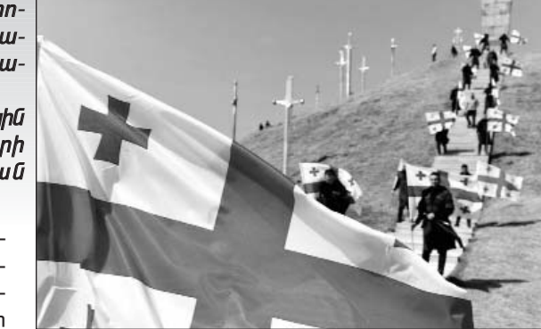
մարտում և դրեց Վրաստանում Ոսկեդարի սկիզբը: Այս իրադարձությունը ոչ միայն մեր պատմության ամենամեծ հանգրվանն է, այլ նաև վրացական ինքնության ու ապագա հաղթանակների հանդեպ հավատի կարեւորագույն որոշիչը», - ասված է վարչապետի շնորհավորական ուղերձում, որը տարածում է Վրաստանի կառավարության վարչակազմը:

Օգոստոսի 12-ին Վրաստանը նշեց «Դիգորոբան»: 1121 թվականին Դավիթ Աղմաշենբեկի թագավորի գլխավորած վրացական բանակը հաղթանակ տարավ սելջուկ թուրքերի դեմ: Շուվի հանգստավայրում տեղի ունեցած տարերային աղետի և դրա արդյունքում մարդկային զոհերի կապակցությամբ «Դիգորոբայի» տոնական միջոցառումները չանցկացվեցին: