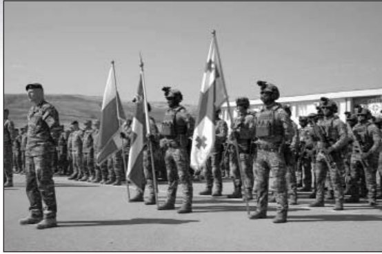
Զորավարժություններին մասնակցում է 21 երկրից ժամանած ավելի քան 3000 զինվորական:

Զորախաղերի մասնակիցներին են դիմել եւ հաջողություններ մաղթել Վրաստանի պաշտպանության ուժերի ղեկավար, գեներալ-մայոր Գիորգի Մաթիաշվիլին, ինչպես նաեւ հանրապետության պաշտպանության փոխնախարար Գրիգոր Գիորգաձեն: