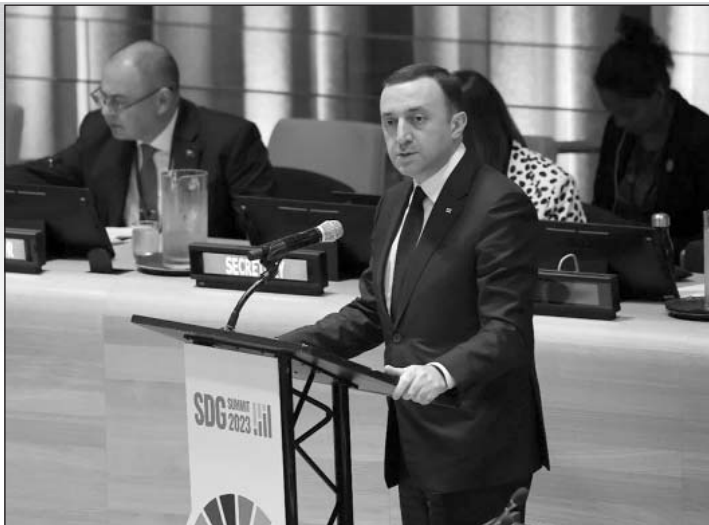
(Շարունակությունը՝ 2-րդ էջում)

Սեպտեմբերի 18-ին, Վրաստանի վարչապետ Իրակլի Դարիբաշվիլին, Նյու Յորքում, Միավորված Ազգերի կազմակերպության գլխավոր ասամբլեայի 78-րդ նստաշրջանի շրջանակներում, մասնակցեց Կայուն զարգացման նպատակների գագաթաժողովի բացմանը, որը չորս տարին մեկ անցկացվում է պետությունների և կառավարությունների ղեկավարների մակարդակով՝ ՄԱԿ-ի Գլխավոր ասամբլեայի հովանու ներքո: