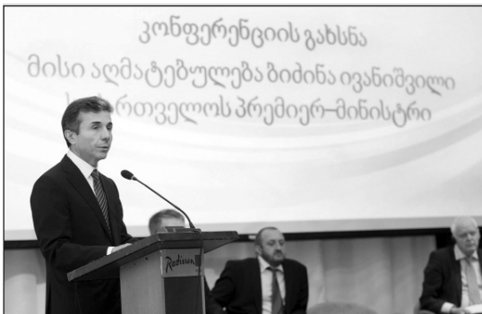
կան առաքելության ներկայացուցիչները: Խորհրդաժողովին մասնակցեցին նաև Վրաստանի կառավարության Խորհրդա-

Թբիլիսիի «Ռեդիսոն» հյուրանոցում կայացավ ՅՈՒՆԻՍԵՖ-ի կազմակերպած Խորհրդաժողովը՝ «Ներդրումը Վրաստանի ապագայում համդիսանում է վաղ հասակում երեխայի կյանքի եւ զարգացման ազգային պլան»: