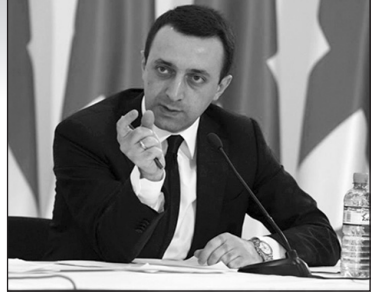
Վրաստանի ներքին գործերի նախարար Իրակլի Դարիբաշվիլին: «Ցանկանում եմ հավաստել, որ այդ տեսագրությունն ընդհանուր ոչինչ չունի «Թալիբանի» հետ: Ըստ առկա տվյալների, տեսագրությունը բեռնվել է Վրաստանից, IP հասցեն պարզվել է եւ բացահայտվել գտնվելու վայրը: Ներկայումս իրականացվում են ակտիվ քննչական միջոցառումներ, դրանց են միացել Հետաքննությունների համերկային բյուրոն, ինչպես նաև մեզ ակտիվորեն օգնում է Իսրայելը»,- ասել է Դարիբաշվիլին:

Հունիսի 6-ին Youtube ցանցում հայտնվել են տեսահոլովակներ, որոնցում թալիբների անունից ինչ-որ մեկը վրիժառությանը է սպառնացել վրացի զինծառայողներին, վրաց ժողովրդին եւ Վրաստանի նախագահին: