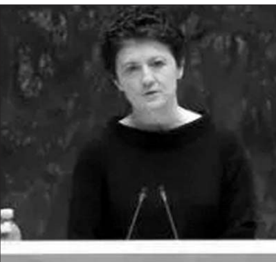
(Հարունակությունը՝ 2-րդ էջում)

Կենտրոնական ընտրական հանձնաժողովի կողմից, իր լիագործություններով, իր լիագործություններով, իր լիագործություններով: