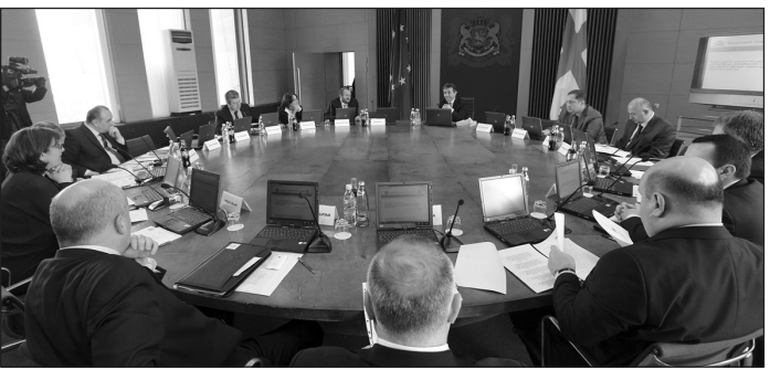
Մույն կարգադրության կատարման մոնիտորինգը իրականացնելու է երկրի կառավարությունը:

կանի օգոստոսի մեկը պետք է մշակի եւ Վրաստանի կառավարությանը ներկայացնի հանրային տեղեկատվության ցանկի նախագիծը, դրա փոխանցման համար անհրաժեշտ միջոցառումների մասին դիտողությունները, «Բաց կառավարման գործընկերության» գործողության նորացված ծրագիրը, հանրային տեղեկատվության մատչելիության ապահովման համար օրենսդրության բարելավման առաջարկությունները եւ այլն: Կոռուպցիայի դեմ պայքարի միջոցառման նպատակով կոորդինացիոն խորհուրդը մինչեւ սեպտեմբերի մեկը պետք է ներկայացնի այն պաշտոնատար ամանց ընդլայնված ցուցակը, ովքեր պարտադիր կարգով հեռակազմի են ներկայացնելու: Կարգադրության մեջ ներառված են նաեւ քաղաքացիական ապահովման այլ, կոնկրետ միջոցառում-