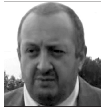
Այսպես, երկրի տարբեր երկրամասերում բնակչության հետ համապատասխան գերատեսչությունների ղեկավարների ու պատասխանատու անձանց հետ հանդիպումներ է անցկացնում կառավար

Այսպիսով երկրում օրեցօր նոր թափ ու ծավալ է ստանում նախագահական քարոզարշավը: Կենտրոնական ընտրական հանձնաժողովին արդեն հայտ է ներկայացրել նախագահության շուրջ 30 թեկնածու: Կողմնակիցների (26 հազար 530) անհրաժեշտ ստորագրահավաքից բացի, թեկնածուները ձեռնամուխ են եղել իրենց նախընտրական ծրագրերի քարոզչությանը: