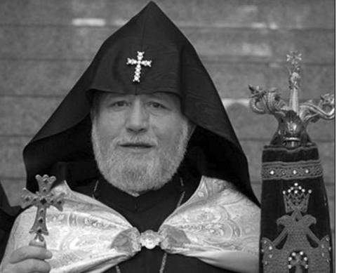
գործունեություն՝ ի բարօրություն ազգի, Հայաստանի եւ, իհարկե, հայ-վրացական թույր եկեղեցիների միջեւ հարաբերությունների ամրապնդման:

«Վրաստան» թերթը իր աշխատակազմի եւ ընթերցողների անունից, որդիական սիրով շնորհավորում է Նորին Սրբությանը ծննդյան տարեդարձի առիթով, մաղթում քաջառողջություն, երկարամյա եւ արգասաբեր հովվապետական