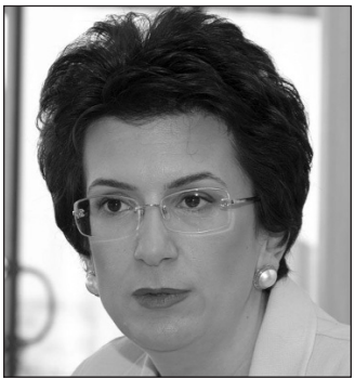
ները, որոնք դեռեւս անցյալ տար