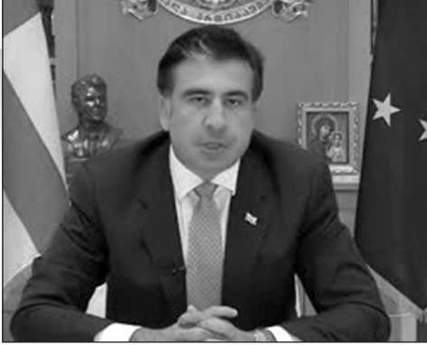
(Շարունակությունը՝ 2-րդ էջում)

Նախագահի խոսքերով՝ ներումը Վրաստանի բազմաթիվ բնակիչների կօգնի