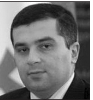
(Շարունակությունը՝ 2-րդ էջում)

րող «Վրացական երազանք» կուլցիայից նախագահության թեկնածու Գիորգի Մարգվելաշվիլին: Նրա նախընտրական ծրագիրը, որոշակի ճշգրտումներով հիմնականում ընդգրկում է բոլոր այն խոստում