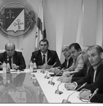
Վրաստանի ֆինանսների նախարարը հանդիպում ունեցավ եկամտային ծառայության ղեկավարների եւ մաքսային ղեկավարման նախարարի հետ:

Սիւստանակ, Խաղուրիձեի նրանց խիստ նախազգուշացրեց եւ կոչ արեց առանձնակի ուշադրություն նվիրել հակակոռուպցիոն միջոցառումներին եւ մաքսային գոտիներում ղեկավարման ղեկավարներին խնդրեցին ինչպես իրենց մագիստրոսները, այնպես էլ՝ Վրաստանի եւ Շվեդիայի օրենսդիր մարմինների խոսակցությունները: