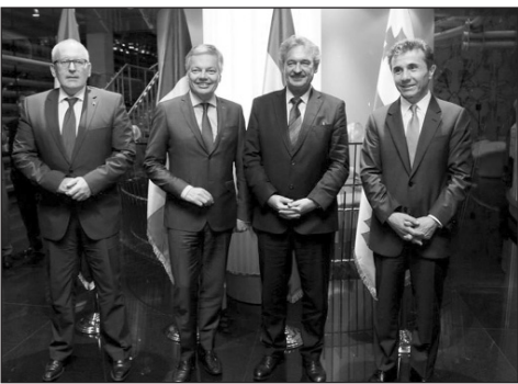
Բենիյուքսի արտաքին գործերի նախարարները, որ երկուսն ալ զանգուշաբար ձեռնարկում են իրենց համագործակցությունը:

Վրաստանի արտաքին քաղաքական գերատեսչության ղեկավարը հյուրերին շնորհակալություն հայտնեց Վրաստանի տարածքային ամբողջականությունը պաշտպանելու եւ եվրոպական ու եվրատլանտյան կառույցներին ինտեգրմանն աջակցելու համար: