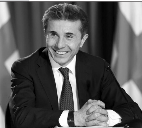
(Շարունակությունը՝ 2-րդ էջում)

«Նախագահի պաշտոնակալությունից մեկ շաբաթ հետո, մինչեւ նոյեմբերի 24-ը, ես կթողնեմ վարչապետի պաշտոնը»,- հայտարարեց Իվանիշվիլին «Ֆրանսպրես» գործակալությանը տված հարցազրույցում: Նա հայտարարեց նաեւ, որ, հավանաբար, նախագահական ընտրությունների արդեն առաջին տուրում կհաղթի կառավարող «Վրասական երազանք» կուլիցիայից թեկնածու Գիորգի Մարգվելաշվիլին: