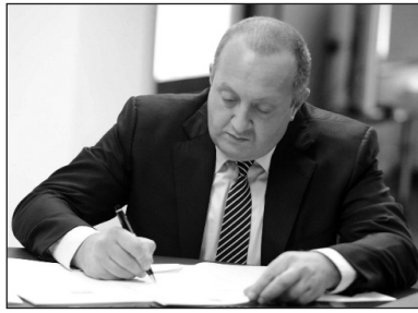
չապետ դառնալուց հետո:

կազմը գրեթե չի փոփոխվել: Նախարարների թիվում միայն մեկն է փոխարինվել: Ներքին գործերի նախարար է նշանակվել Ալեքսանդր Գիկալիձեն, այդ պաշտոնը թափուր էր մնացել Դարիբաշվիլու վար-