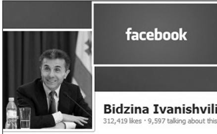
Bidzina Ivanishvili 312,419 likes · 9,597 talking about this

իշխանությունը, իրենց իսկ խնդրանքով խորհուրդներ էի տալիս: Իմ նախաձեռնությամբ ֆինանսավորում էի այն հիմնադրամը, որը 2,5 տարի համձնում էր կառավարության եւ խորհրդարանի աշխատավարձը, որպեսզի երկիրը կարողանար դուրս գալ կոռուպցիայի ճահճից եւ ընթանար եվրոպական զարգացման ուղիով: