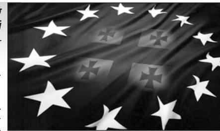
(Շարունակությունը՝ 2-րդ էջում)

կան առումով. քանի որ դա թույլ կտա ներգրավել մեծ ծավալի ներդրումներ, արդիականացնել Վրաստանի դեռևս թույլ էկոնոմիկան, ներթափանցել եվրոպական շուկա: «Եվրոպական շուկան ամենամեծն է