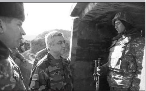
Սերժ Սարգսյանը տոնական սեղանի շուրջ գրուցեց զինվորների հետ, շնորհավորեց Հայոց բանակի բոլոր զինծառայողներին գալիք տոների կապակցությամբ:

Հայաստանի նախագահ, Հայաստանի զինված ուժերի գերագույն զխավոր հրամանատար Սերժ Սարգսյանը Ամանորի եւ Սուրբ Ծննդյան տոների կապակցությամբ, Ամենայն Հայոց Կաթողիկոս Գարեգին Երկրորդի, Հայաստանի պաշտպանության նախարար Սեյրան Օհանյանի եւ գրող, հրապարակախոս Ջորի Բալայանի հետ դեկտեմբերի 31-ին այցելեց երկրի հյուսիս-արեւելյան հատվածի սահմանագիծը պահող պաշտպանական տեղամասերից մեկը: