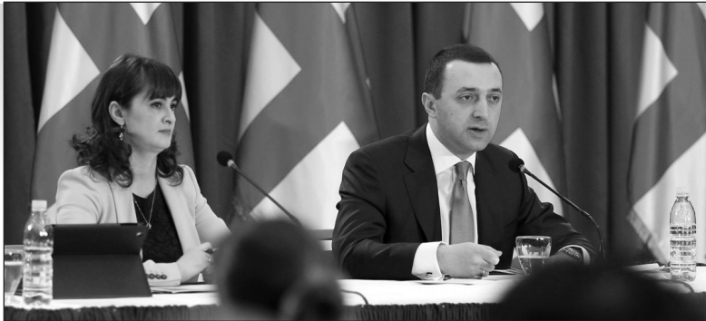
ՄԵՐ ԿՈՒՐՍԸ ՄՆՈՒՄ Ե ԱՆՓՈՓՈՒՄ ԵՎՐԱՆՏԵԳՐՈՒՄ ԵՎ ՆԱՏՕ

Հունվարի 16-ին Վրաստանի վարչապետ Իրակլի Դարիբաշվիլին հանդիպումներ ունեցավ վրացական եւ օտարերկրյա լրատվամիջոցների ներկայացուցիչների հետ եւ պատասխանեց նրանց հետաքրքրող հարցերին: