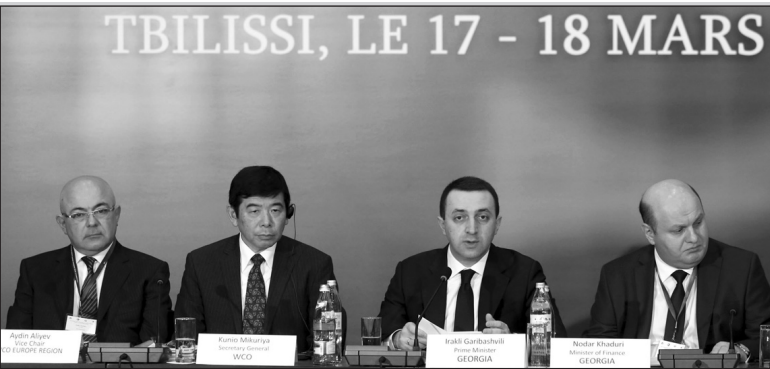
TBILISSI, LE 17 - 18 MARS

Մարտի 17-18-ին, Թբիլիսիում անցկացվեց Համաշխարհային մաքսային կազմակերպության եվրոպական տարածաշրջանի երկրների մաքսային ծառայությունների ղեկավարների խորհրդաժողովը, որի աշխատանքին մասնակցեցին Վրաստանի վարչապետ Իրակլի Դարիբաշվիլին, ֆինանսների նախարար Նոդար Խաղոբիան և հատուկ այդ խորհրդարանի համար Թբիլիսի ժամանած Համաշխարհային մաքսային կազմակերպության գլխավոր