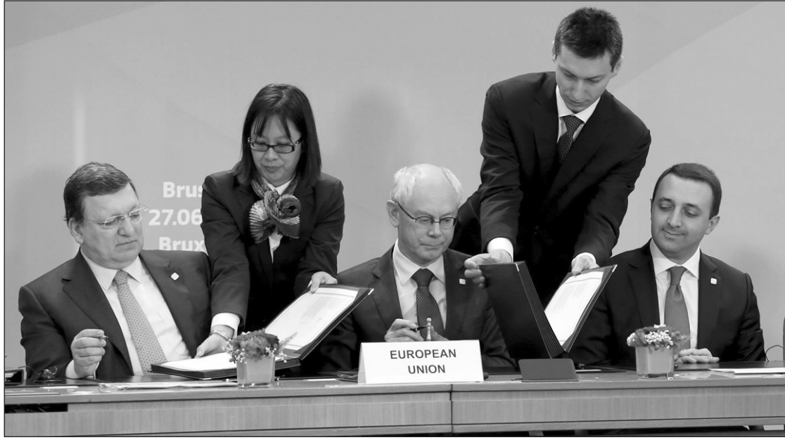
վեց այն ուղին, որը առավել խորացնելու է ամրացնելու է մեր հարաբերությունները»,- ընդգծեց վարչապետը: (Շարունակությունը՝ 2-րդ էջում)

րին՝ Եվրոպային: Միջավայր, որից մենք հարյուրավոր տարիներ արհեստականորեն անջատված էինք»,- իր ելույթում հայտարարեց Վրաստանի վարչապետ Իրակլի Դարիբաշվիլին: Նրա խոսքերով, հունիսի 27-ը բացառիկ ամսաթիվ է, քանզի մեր երկրի պատմության մեջ առաջին անգամ ստացվեց այնպես, որ բոլորը հաստատակամորեն, էլնելով համընդհանուր համաձայնությունից և ընդհանուր արժեքներից, միացան քաղաքական և տնտեսական վիթխարի միությանը: «Այսօր բացարձակապես նոր փուլ է սկսվում Վրաստանի և Եվրամիության միջև: Այսօր սկս-