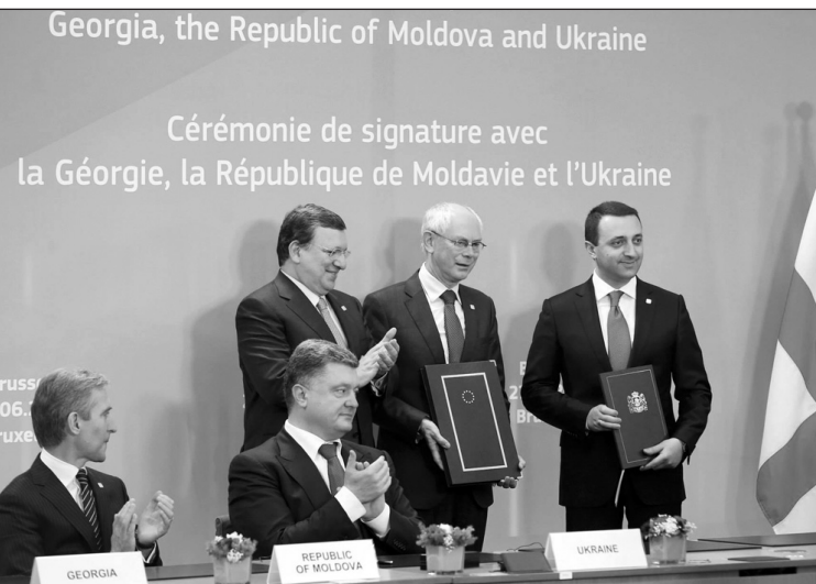
Georgia, the Republic of Moldova and Ukraine. Cérémonie de signature avec la Géorgie, la République de Moldavie et l'Ukraine.

Եվրահանձնաժողովի նախագահ Ժոզե Մանուել Բարրոզու, ընդգծելով Ասոցիացման համաձայնագրի ստորագրման նշանակությունը, նշեց, որ համաձայնագիրը ստորագրած երկրներն ստանում են բարեփոխումների անցկացման եւ էկոնոմիկայի զարգացման հնարավորություն: Միաժամանակ, Բարրոզու վստահեցրեց, որ Ասոցիացման համաձայնագիրը ոչ մեկի դեմ ուղղված չէ: