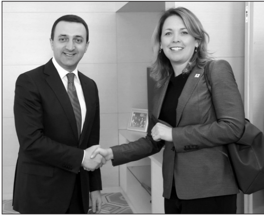
Հանդիպմանը քննարկվեցին Վրաստանի և ամերիկյան Սան Դիեգո պետական

Վրաստանի վարչապետ Իրակլի Դարիբաշվիլին հանդիպում ունեցավ «Հազարամյակի մարտահրավեր» կորպորացիայի գործադիր տնօրեն Դենա Չայդեի հետ: