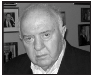
ըր պատերազմը» խաղաղությամբ չէր ավարտվի»,- ընդգծել է Բեյթերը: Էդուարդ Շեւարդնաձեի մահացել է հուլիսի 7-ին, 86 տարեկան հասակում: