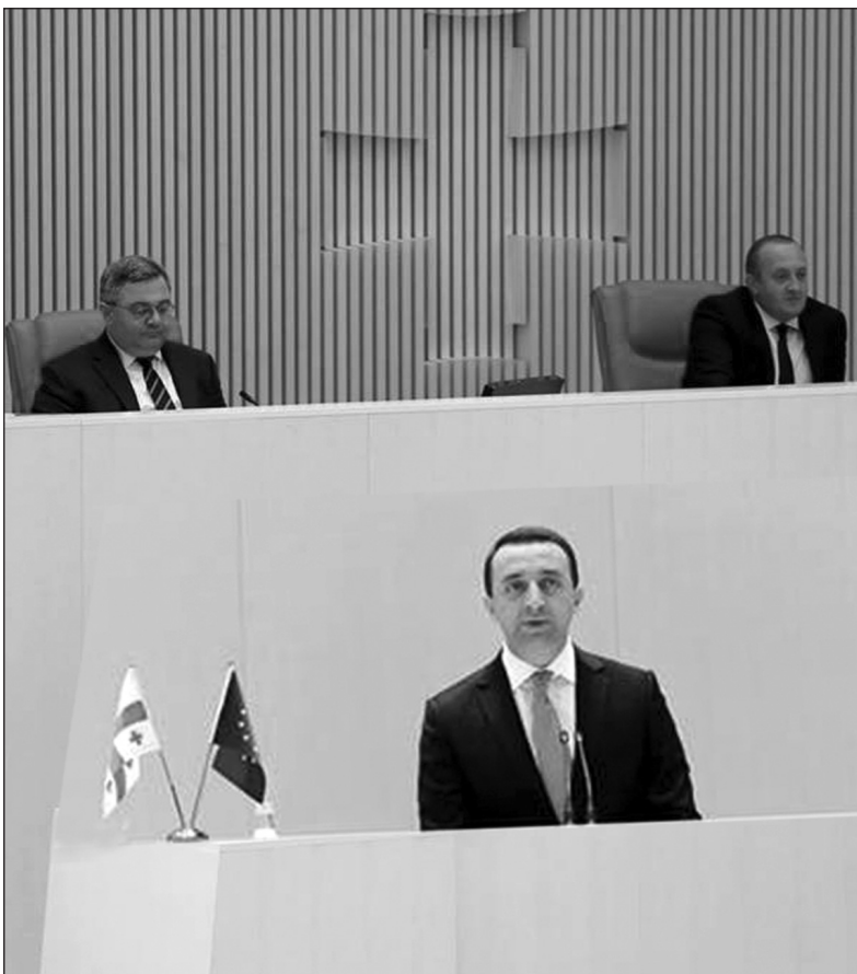
Երկրի համար ասոցիացման համաձայնագրի վիճարկման նշանակությունը, դրա դրական, խթանիչ ազդեցությունը ինչպես վրաց էկոնոմիկայի զարգացման, այնպես էլ Վրաս-

Բոլոր ելույթներում միանշանակորեն ընդգծվում էր