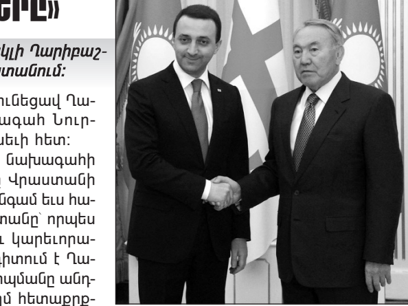
(Շարունակությունը՝ 2-րդ էջում)

Նոյեմբերի 12-13-ին Վրաստանի վարչապետ Իրակլի Դարիբաշվիլին աշխատանքային այցով գտնվում էր Ղազախստանում: Վարչապետի գլխավորած պատվիրակության կազմում էին փոխվարչապետ, էներգետիկայի նախարար Կախի Կալաձե, էկոնոմիկայի և կայուն զարգացման նախարար, փոխվարչապետ Գիորգի Վիլիկաշվիլին, գյուղատնտեսության նախարար Օթար Դանելիան, ֆինանսների նախարար Նոդար Խաղոբիան: Այցի շրջանակներում, Վրաստանի կառավարության ղեկավարը հանդիպում ունեցավ Ղազախստանի նախագահ Նուր-տուլբան Նազարբաևի հետ: Ղազախստանի նախագահի հետ հանդիպմանը Վրաստանի վարչապետը մեկ անգամ եւս հավաստեց, որ Վրաստանը՝ որպես բարեկամ երկիր և կարեւորագույն գործընկեր, դիտում է Ղազախստանը: Հանդիպմանը անդրադարձան երկկողմ հետաքրքրություն ներկայացնող հարցեր: