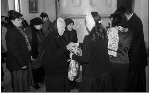
րիքն ունեցող ընտանիքներին:

նակ եւ հաշմանդամ ծերեր: Չատկական նվերներ բաժանելու գործողությունը Վիրահայոց թեմում արդեն դարձել է բարի ավանդույթ, որ մեծ սիրով իրականացվում է Հավաքարի հայոց եկեղեցում: Հետանուտ լինելով Քրիստոսի Հարաշահաբ Հարության տոնը բոլոր ընտանիքներում տոնական դարձնելու նպատակին՝ թբիլիսահայ հավատացյալներն իրենց օգնությունն են ցուցաբերում դրա կա-