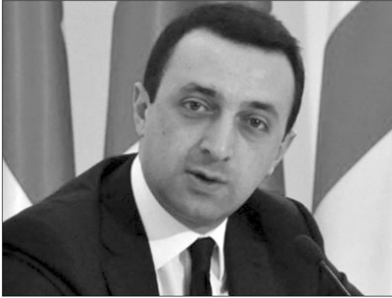
Վրաստանի վարչապետ Իրակլի Դարիբաշվիլին արձագանքելով բռնագավթման գոտում զարգացող իրադարձություններին, (Շարունակությունը՝ 2-րդ էջում)