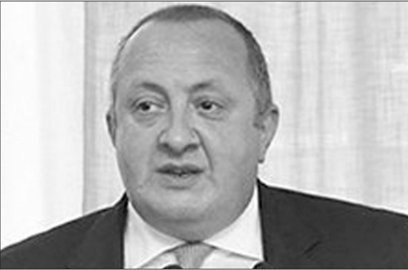
«Վրաստանի յուրաքանչյուր քաղաքացու եւ ինձ համար անընդունելի է ինքնիշխան տարածքում բաժանարար գծի յուրաքանչյուր նոր մետրը՝ հատկապես, երբ այդ գիծն անցնում է արտակարգ նշանակության»

Վրաստանը Ռուսաստանին մեղադրում է Յիսիմվալի տարածաշրջանում սահմանների տեղափոխման մեջ: Յիսիմվալի տարածաշրջանում սահմանի բաժանարար գծի տեղափոխմամբ դեպի վրացական Ճիթելուբանի, Խուրվալետի եւ Օրջոսանի գյուղերի տարածքների խորքերը, «Քաբու-Սուփսա» նախաձեռնության մի շարք հատվածներ (մոտ՝ 16 կիլոմետր) դուրս են մնացել Վրաստանի իշխանության վերահսկողության գոտուց: