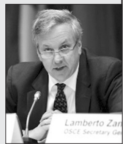
Lamberto Zar... OSCE Secretary Ge...

Միացյալ Նահանգների Սենատը Վրաստանում այդ երկրի արտակարգ եւ լիազոր դեսպանի պաշտոնում հաստատել է պրոֆեսոր Նալբանդյանի անունով Գեորգի Մարգվելաշվիլին ստորագրեց ներքին գործերի նախարարության բարեփոխման մասին օրենքը, ըստ որի՝ գերատեսչության կազմից կազմվում է անվտանգության ծառայությունը: