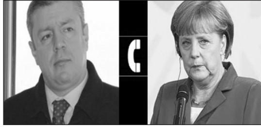
Կարողանա գտնվել 90 օրից ոչ ավելի:

Ավելացնենք, որ Եվրահանձնաժողովը 2015 թվականի դեկտեմբերի 18-ին դրական եզրակացություն է հրապարակել ԵՄ-ի երկրների հետ այցեգրային ռեժիմի ազատականցմանը Վրաստանի պատրաստ լինելուն մասին: Եթե Եվրախորհրդարանականները հավանություն տան օրինագծին, Վրաստանի քաղաքացիները Շենգենյան գոտու երկրներում կկարողանան գտնվել 90 օրից ոչ ավելի: