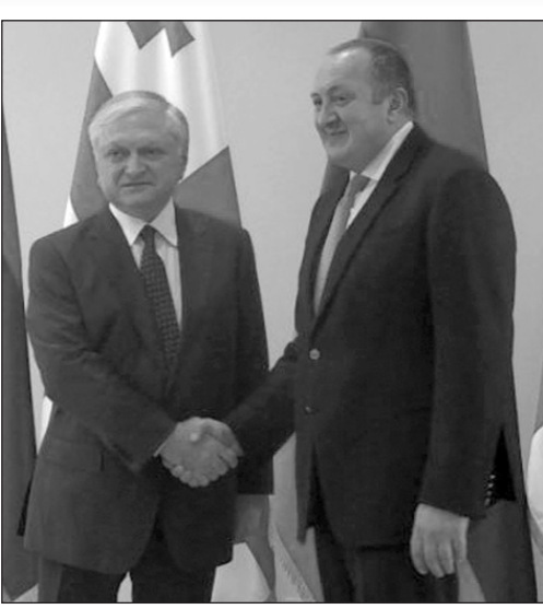
(Շարունակությունը՝ 2-րդ էջում)

Ողջունելով հյուրին, Վրաստանի նախագահն ընդգծեց, որ միշտ հաճելի է բարեկամ Հայաստանից բարձրաստիճան հյուրեր ընդունել եւ քննարկել երկու հարեւանների միջեւ բարիդրացիական հարաբերությունների առավել զարգացման հնարավորությունները: Շնորհակալություն հայտնելով ընդունելության համար՝ Էդվարդ Նալբանդյանը Վրաստանի նախագահին փոխանցեց Հայաստանի նախագահի ողջույններն ու բարեմաղթանքները եւ տեղեկացրեց Թբիլիսիում իր ունեցած հանդիպումների ու քննարկումների արդյունքների մասին: Հանդիպման ընթացքում զրուցակիցները քննարկեցին վրաց-հայկական փոխգործակցության ընդլայն-