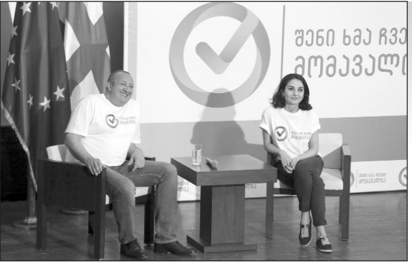
Ելույթ ունենալով Սցիսթա-Մ- պետք է շրջեք քաղաքներում, գյու-

Վրաստանի նախագահ Գիորգի Մարգվելաշվիլու նախաձեռնությամբ մեկնարկեց «Քո ձայնը մեր ապագան է» նախընտրական արշավը, որը նպատակ ունի ներգրավել երկրի քաղաքացիներին հոկտեմբերի 8-ին անցկացվելիք խորհրդարանական ընտրություններին: