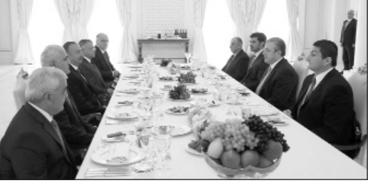
Մաքեի արտաքին գործերի փոխնախարար Գիգի Գիգիձենը:

Օգոստոսի 31-ին Վրաստանի վարչապետ Գիորգի Կվիրիկաշվիլին մեկօրյա պաշտոնական այցով գտնվում էր Բաքվում: