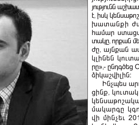
Կիսանի կենսաթոշակային տարիքի: Այն դեպքում, երբ կուտակված գումարը փոքր է, ապա կենսաթոշակառուն կկարողանա այն լրիվությամբ ստանալ, եթե գումարը

Կուտակումային մոդելի հիմնադրամի համաձայն, համաձայնակցության սկզբունքը կլինի հետեւյալը. քաղաքացին կենսաթոշակային հիմնադրամ է փոխանցելու աշխատավարձի 2 տոկոսը, 2-ական տոկոսի փոխանցում են կատարելու գործատունն եւ պետությունը: Ընդհանուր առմամբ, մի կենսաթոշակառուի հաշվով, հիմնադրամ կփոխանցվի աշխատավարձի 6 տոկոսի չափ գումար: Գործադիր իշխանությունը ծրագրում է կենսաթոշակային համակարգի նոր մոդելի ներդրումը իրականացնել 2017 թվականի հոկտեմբերից: