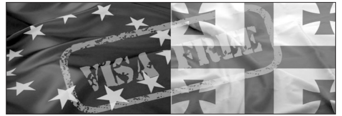
թյան (Շենգենյան գոտու անդամ երկրներում աշխատանքի) տեւական ուսուցման իրավունքը:

* Եվրամիություն/Շենգենյան գոտու անդամ երկրների տարածք մուտք գործելու ժամանակ Վրաստանի քաղաքացին.