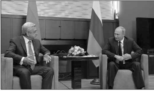
Սերժ Սարգսյանի և Վլադիմիր Պուտինի հանդիպումը Սոչիում:

Օգոստոսի 23-ին, Հայաստանի նախագահ Սերժ Սարգսյանը, Ռուսաստանի Դաշնություն աշխատանքային այցի շրջանակներում, Սոչիում հանդիպում ունեցավ ՌԴ նախագահ Վլադիմիր Պուտինի հետ: