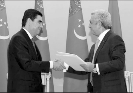
Սերժ Սարգսյանը և Գուրբանգուլի Բերդիմուխամբեզովը Սոչիում:

Ի պատիվ պաշտոնական այցով Հայաստանում գտնվող Թուրքմենստանի նախագահ Գուրբանգուլի Բերդիմուխամբեզովի՝ երեկոյան, նախագահ Սերժ Սարգսյանի անունից, տրվեց պաշտոնական ճաշկերույթ: