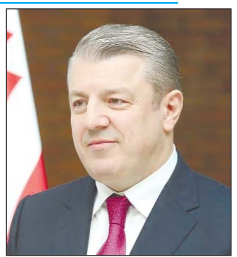
ԳԻՐԳԻ ԿՎԻՐԻԿԱՇՎԻԼԻ Վրաստանի վարչապետ