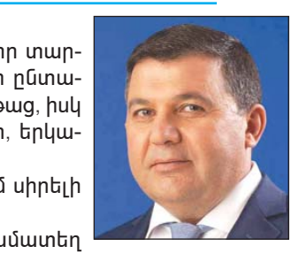
ՀԵՆՋԵԼ ՄԿՈՅԱԼ Վրաստանի խորհրդարանի մեծամասնական պատգամավոր