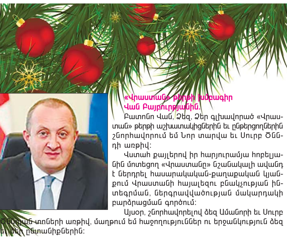
ԳԻՐԳԻ ՄԱՐԳՎԵԼԱՇՎԻԼԻ Վրաստանի նախագահ