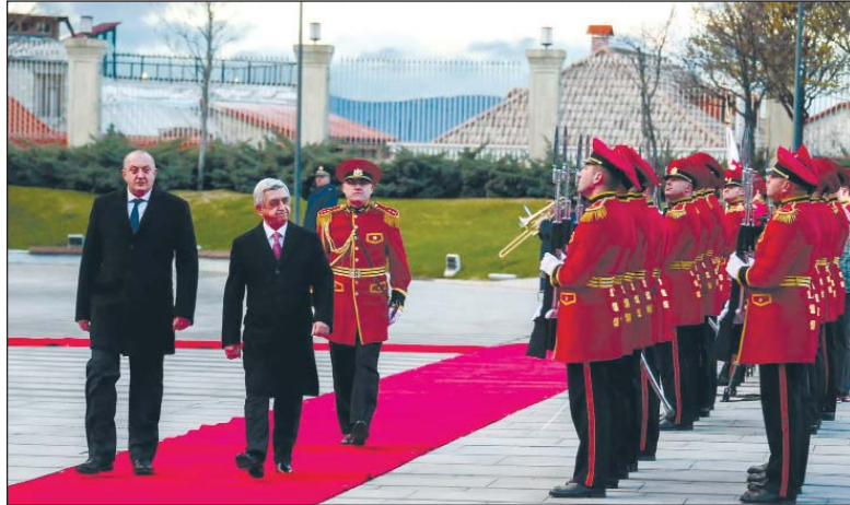
(Շարունակությունը՝ 4-րդ էջում)

Վրաստանի նախագահի նստավայրում, Հայաստանի նախագահի դիմավորման պաշտոնական արարողությունից հետո, անցկացվեց երկու երկրների նախագահներ Գիորգի Սարգվելաշվիլու եւ Սերժ Սարգսյանի առանձնազրույցը, որին հաջորդեց երկու երկրների պատվիրակությունների մասնակցությամբ ընդլայնված կազմով վրաց-հայկական բարձր մակարդակի բանակցությունները: