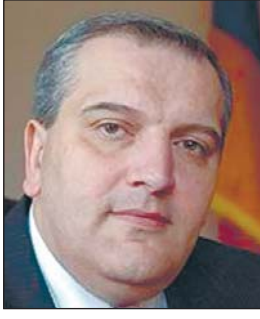
(Շարունակությունը՝ 2-րդ էջում)

Սիրելի՛ վիրահայեր, եղբայրական վրացի ժողովուրդ. Սրտանց շնորհավորում եմ ձեզ Ամանորի եւ Սուրբ Ծննդյան տոների առթիվ՝ ձեզ եւ ձեր ընտանիքներին մաղթելով առողջություն, արելաշատություն եւ նորանոր հաջողություններ: Մի քանի օրից մենք իրաժեշտ կտանք 2017 թվականին, թվական, որը լի էր բազմաբնույթ իրադարձություններով, որից ամմասն չմնացին նաեւ հայ-վրացական հարաբերությունները: Այս տարի մենք տոնեցինք հայ-վրացական դիվանագիտական հարաբերությունների հաստատման 25-ամյակը: Արդեն քառորդ դար է մեր ժողովուրդները՝ որպես անկախ եւ սուվերեն պետությունների քաղաքացիներ, հարաբերվում են միմյանց հետ, արդեն քառորդ դար է մեր պետությունները ավելի են խորացնում հայ-վրացական եղբայրական հարաբերությունները: Թող 2018 թվականն այդ առումով լինի բեղմնավոր եւ հաջող տարի, տարի, որի ընթացքում կգրանցվեն անմասխաղեպ հաջողություններ: Նախատոնական այս օրերին շատ խորհրդանշական էր Հայաստանի նախագահ Սերժ Սարգսյանի Վրաստան կատարած այցը, որը, վստահությամբ պետք է նշել, է՛լ ավելի ամրացրեց մեր երկկողմ հարաբերությունները եւ