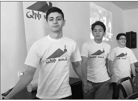
սփյուռքահայ երիտասարդ՝ աշխարհի 37 երկրից:

Երեւանի քաղաքապետարանի կողմից, 2017 թվականին, «Արի՝ տուն» ծրագրին 8 փուլով մասնակցեց շուրջ 1000