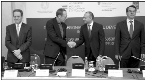
Քը ստորագրեցին նոր նախագծի իրականացման համաձայնա-

գիր, որը նպաստելու է Վրաստանում տարածաշրջանային եւ տեղական զարգացմանը: