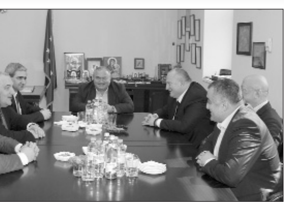
(Շարունակությունը՝ 4-րդ էջում)

Այցի շրջանակներում՝ առաջին պաշտոնական հանդիպումը տեղի ունեցավ վիսայի խեռում, որտեղ Սամցխե-Ջավախեթի պե-