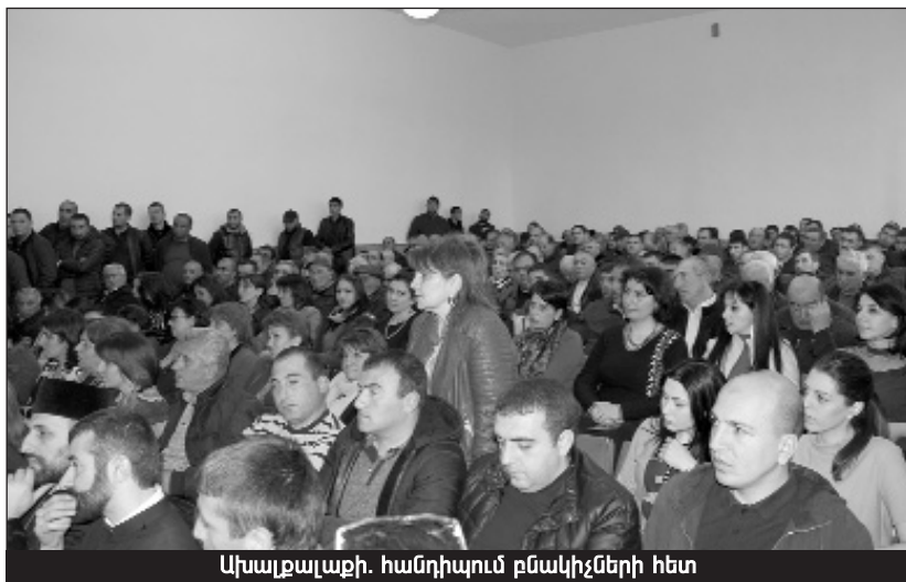
Ախալքալաքի հանդիպում բնակիչների հետ