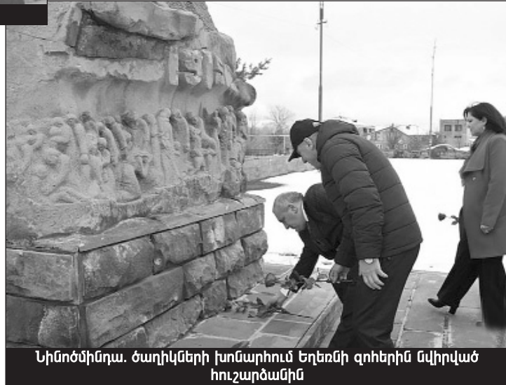
Նինոծմինդա. ծաղիկների խոնարհում եղեռնի զոհերին նվիրված հուշարձանին