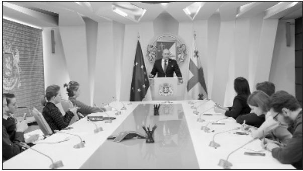
Բախտաձեի խոսքով, նախաձեռնությունների նպատակն է՝ Վրաստանում

Վրաստանի ֆինանսների նախարար Մամուկա Բախտաձեն, հանդես գալով մամուլի առաջին հարցազրույցում, հայտարարեց, որ գերատեսչության կողմից նախաձեռնած նախագծերը նորարարական են, եւ Վրաստանը կլինի առաջին երկիրը, որը նման բարձր մակարդակի ոլորտացված ընթացակարգ է առաջարկում հարկատուներին: