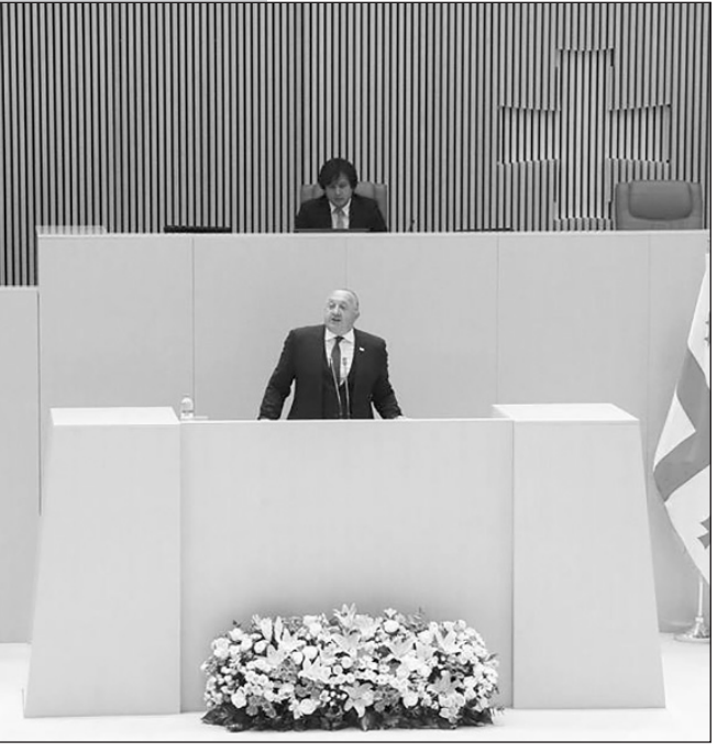
(Շարունակությունը՝ 2-րդ էջում)

Ընթացակարգով սահմանված մեկ ժամի փոխարեն 20 րոպեանոց իր խոսքում, նախագահ Գիորգի Մարգվելաշվիլին փորձեց հանրագումարել նախագահական իր ժամանակահատվածի գործունեությունը՝ մակերեսորեն անդրադառնալով երկրի իրատեսիլ թեմաներին: Նախագահը, խոսելով մեր սահմանադրության շուրջ, պատգամավորներին խորհուրդ տվեց, նախքան մեր հիմնական