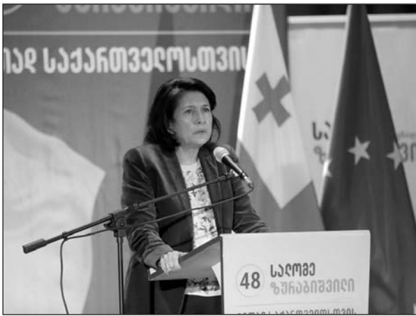
Հոկտեմբերի 28-ին անցկացվելիք նախագահական ընտրությունների քարոզարշավի շրջանակներում, նախագահի անկախ թեկնածու Սալոմե Զուրաբիշվիլին, Դուշեթիում հանդիպում ունենալով ընտրողների հետ, հայտարարեց, որ ատելության լեզուն իր համար օտար է: «Դա կարող է տեղ գտնել միայն քաղաքական քննադատությունում, բնական է, տարակարծության համար նույնիսկ պարտադիր»,- ասաց նա:

Ատելության լեզուն ինձ համար օտար է, այս առումով ես իսկական վրացի եմ, քանի որ վրացական մշակույթը սկսվում է դաստիարակությամբ: Սա բոլորի, առաջին հերթին նախագահի պարտականությունն է, որպեսզի երիտասարդներին օրինակ ծառայի, թե ինչպես է պետք ջանք գործադրել երկրի հզորացման եւ միավորման համար,- հայտարարեց Զուրաբիշվիլին եւ հավելեց, որ ատելության լեզուն կխանգարի հասնել Վրաստանի տարածքային ամբողջականության ճանաչմանը: